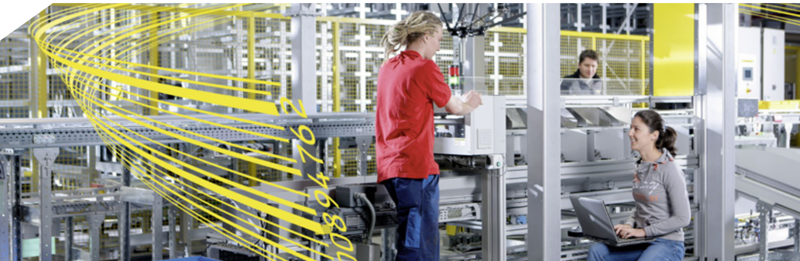
Kundenreferenz: SSI SCHÄFER

Die keytech Software GmbH ist seit 1993 auf die Optimierung von Geschäftsprozessen spezialisiert und zählt heute zu den Marktführern von Product Lifecycle Management (PLM)-Systemen "Made in Germany". Die Resultate für die Kunden sind effiziente Prozesse und Qualitätssteigerungen, die sich spürbar auf die Rentabilität auswirken.